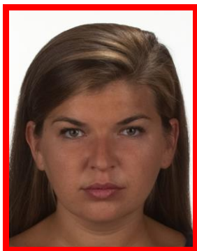
zdjęcie za ciemne