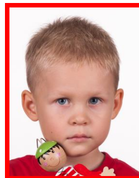
zabawka zakrywająca część twarzy

Należy pamiętać, że w przypadku dzieci do piątego roku życia nie są wymagane zdjęcia wykonywane według zasad obowiązujących przy fotografii osób pozostałych.