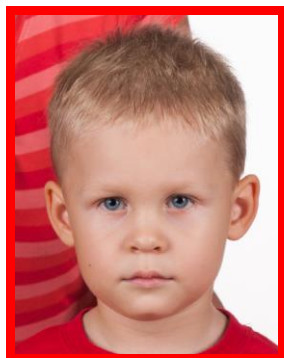
osoba widoczna w kadrze