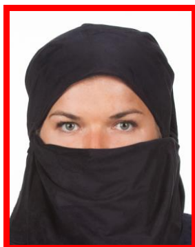
osoba z nakryciem głowy i twarzy