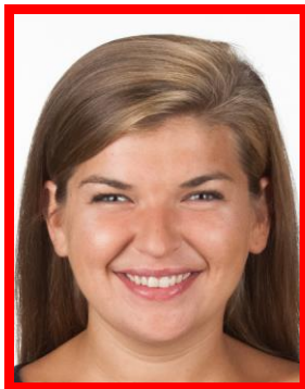
nienaturalny wyraz twarzy