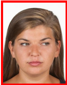
zły kierunek patrzenia

Wzrok osoby fotografowanej musi być skierowany prosto w obiektyw aparatu. Oczy muszą być naturalnie otwarte, wyraźnie widoczne (nie mogą być zakryte przez włosy). Na zdjęciu niedopuszczalny jest efekt „czerwonych oczu”.