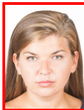
zdjęcie za jasne