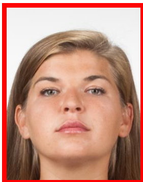
tw. żabia perspektywa