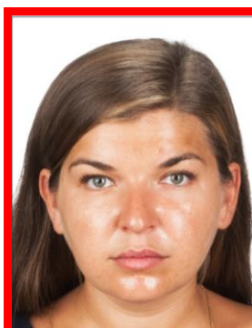
refleksy na twarzy