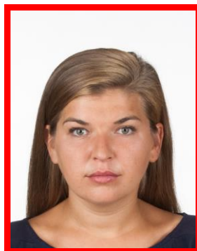
zbyt mała twarz