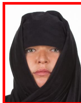
osoba z nakryciem głowy i twarzy