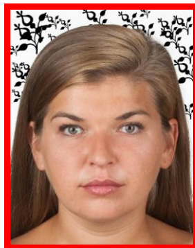
widoczny wzór na tle