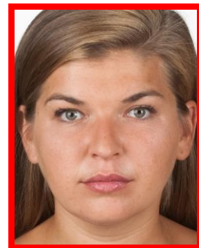
zbyt duża twarz