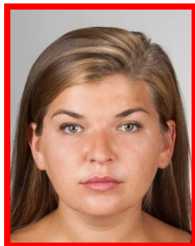
niejednolicie oświetlone tło

Tło białe oświetlone jednolicie, pozbawione cieni i elementów ozdobnych. Zdjęcie musi pokazywać tylko osobę fotografowaną (żadne inne osoby lub przedmioty nie mogą być widoczne).