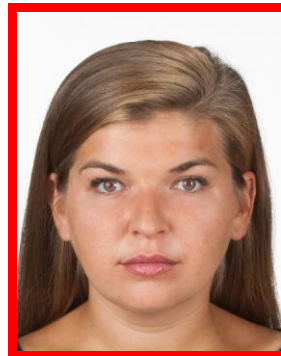
efekt czerwonych oczu