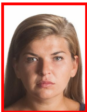
nierównomierne oświetlenie twarzy

Twarz musi być oświetlona równomiernie. Niedopuszczalne są refleksy (odbicia światła na skórze czy włosach powodujące białe plamy w tych miejscach) oraz cienie na twarzy.