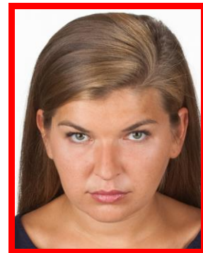
tw. ptasia perspektywa