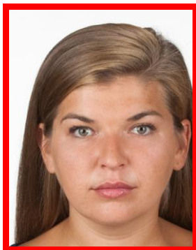
przesunięta twarz do jednej z krawędzi zdjęcia